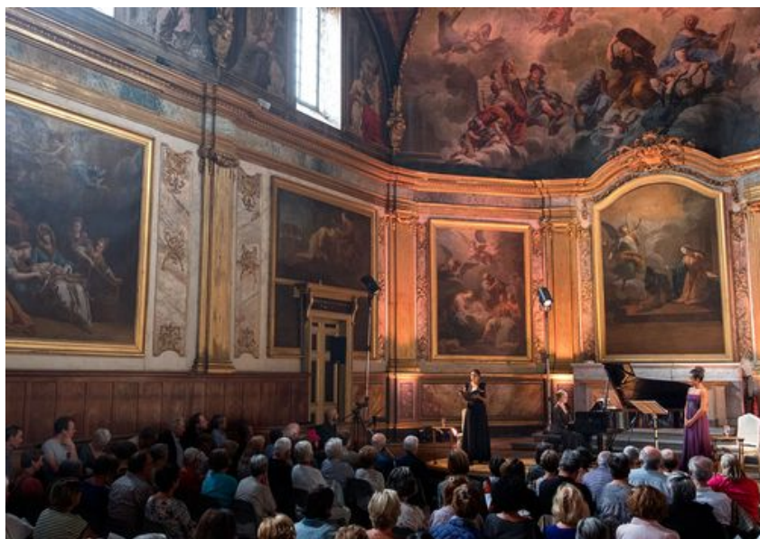
Les trois interprètes dans l'écrin de la Chapelle des Carmélites