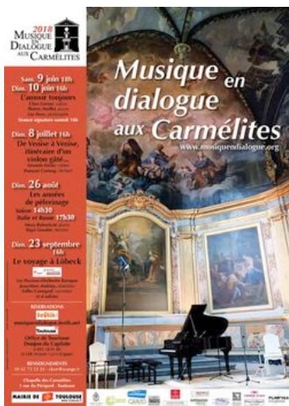
L'affiche de la saison avec les programmes des quatre concerts

Le concept de cette série consiste toujours à marier lettres et notes en un dialogue parfaitement en situation dans ce lieu magique. L'allusion à Francis Poulenc et à son Dialogues des Carmélites résonne ici comme un clin d'œil. Cette initiative résulte de la volonté de la Mairie et de la Métropole d'animer les grands lieux du patrimoine toulousain. La Chapelle des Carmélites en est le symbole idéal pour faire dialoguer la musique de chambre avec des textes littéraires, poétiques, philosophiques ou historiques. Les artistes invités, musiciens, acteurs, philosophes..., tous de premier plan, partagent leur approche des grandes œuvres du répertoire international.